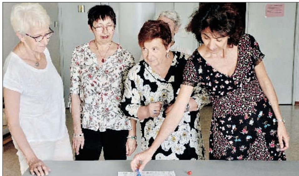
Avec la reprise d'un atelier qui participe de la connaissance de soi, cette thérapeute aveyronnaise a utilisé le jeu de l'oie comme outil de communication, pour être en confiance au sein du groupe.