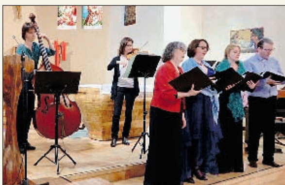
Des chanteurs et des musiciens sous le charme de Jean-Sébastien Bach, immense et génial inventeur de la dramaturgie religieuse.

Samedi 5 octobre, à 20h30, en l'église de Cabanes, à Labastide-L'Evêque, et dimanche 6 octobre, à 15h30, en l'église de Calmont-de-Plantage, les cinq chanteurs et cinq musiciens de l'association Affetti Nostri se produiront avec deux concerts sur le thème flamboyant « Bach et ses contemporains ».